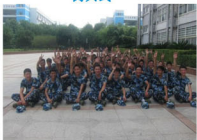
训练场上也充满欢声笑语