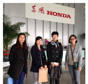
东风本田汽车有限公司