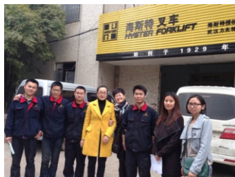
力夫特工业设备有限公司

(通讯员李霞) 在汽车工程学院领导的高度重视和共同努力下,学院就业回访工作取得了显著成效。学院组织就业回访小组,深入用人单位,对已就业的毕业生进行跟踪回访,了解他们的就业状况、工作满意度及遇到的困难。通过回访,学院及时了解了用人单位的需求,为后续就业指导提供了有力支持。同时,也帮助毕业生解决了后顾之忧,增强了他们对学校的归属感和忠诚度。