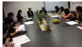
大华联保湖北投资有限公司